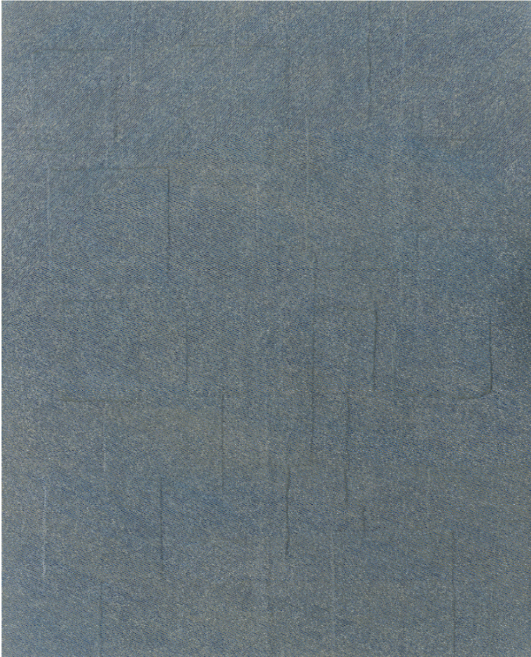
정병현 작 'Ambiguous Inclination'